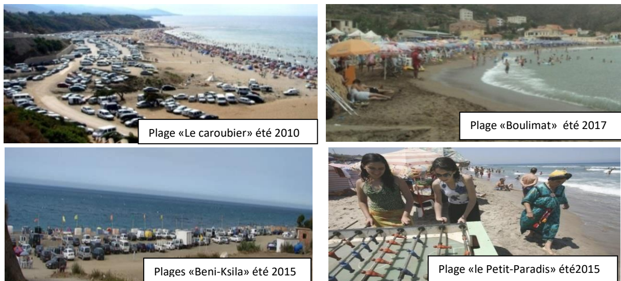
Figure 2. Le flux des estivants nationaux sur les plages de la région.

Les images, prises par l'auteur, montrent le rush d'estivants qui viennent fréquenter les plages de la région. Sur la plage «le Petit-Paradis» située dans la côte-est d'Azeffoun limitrophe avec la région littorale de Beni-Ksila, l'image nous renseigne sur la pratique touristique des nationaux où nous voyons les formes d'imitation des modèles occidentaux se combinent avec les formes inventées inhérentes aux cultures locales.